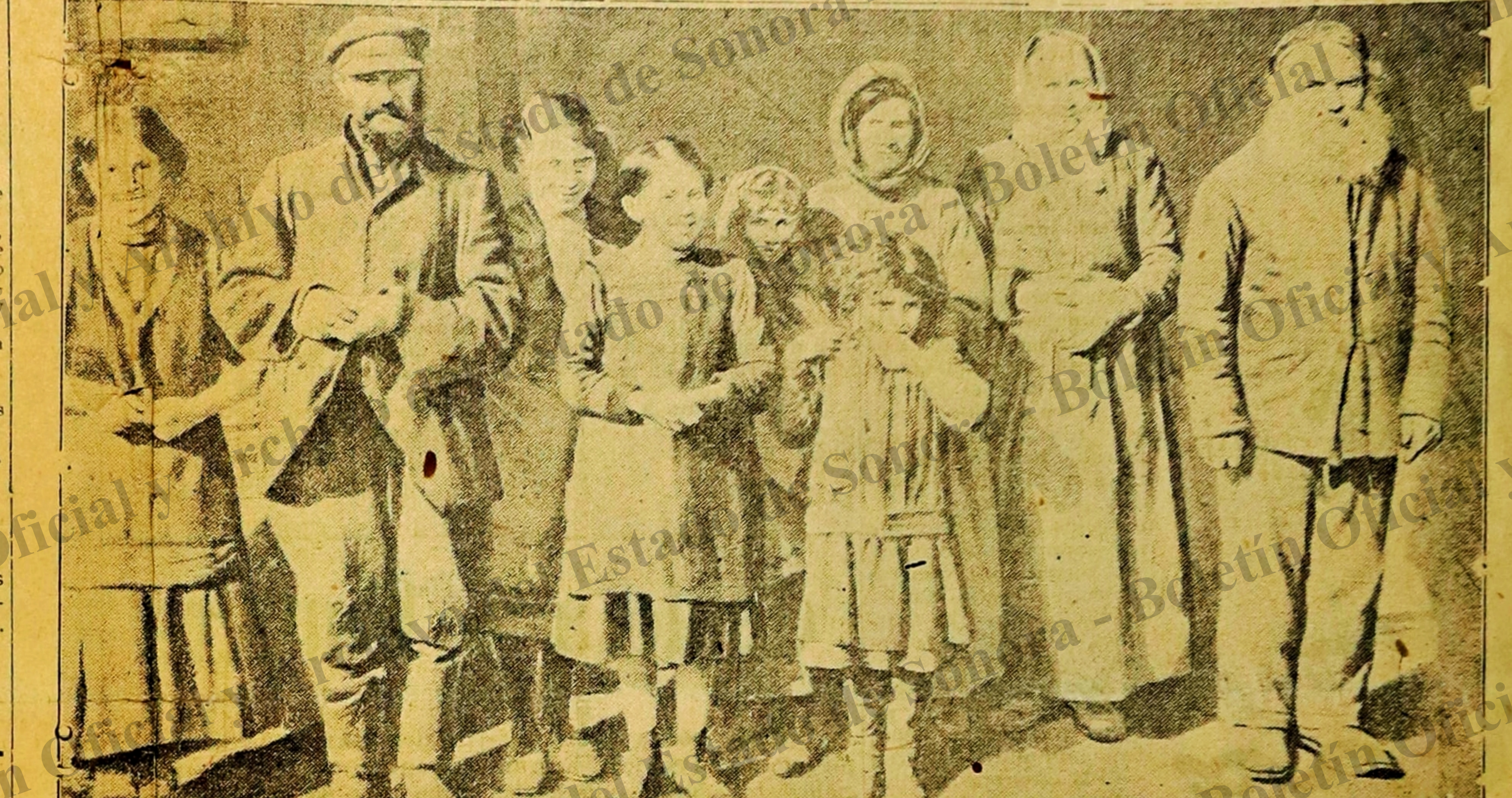
Los no-combatientes emigraron pensosamente del hermoso puerto ruso de Riga, cuando las divisiones alemanas marcharon sobre la Plaza

Se hacen toda clase de arreglos de piezas para piano, orquesta, o estudiantinas de instrumento de cuerda. Dirección: "El Norte" Calle de Elías No. 7 Nogales Son.